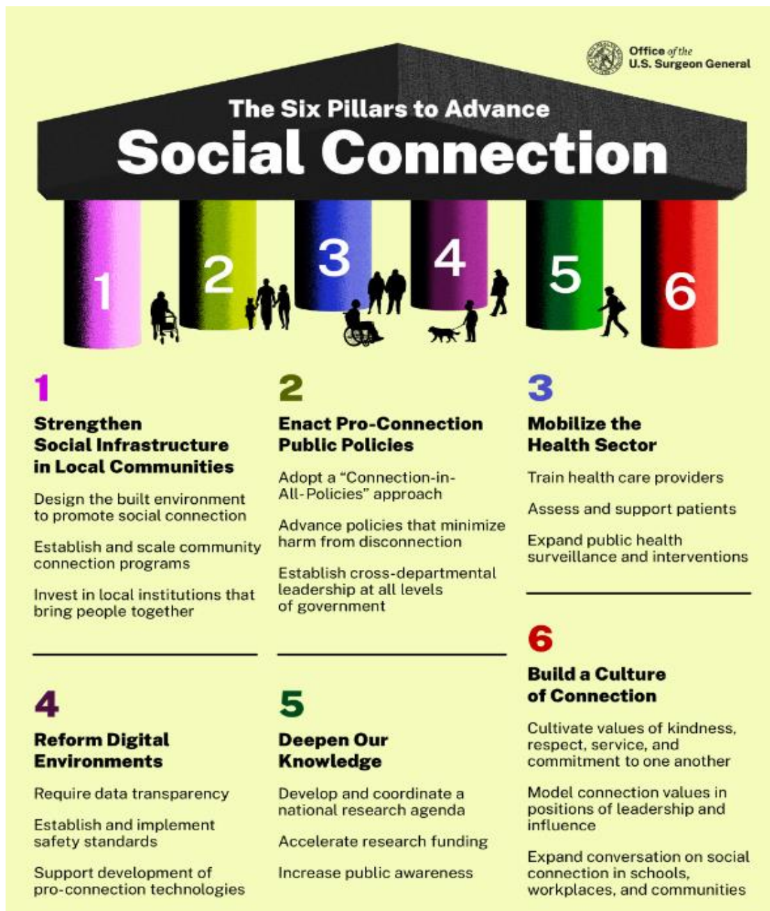
Figur 2: Sechs Pfeiler zur Förderung der sozialen Vernetzung gemäss US Surgeon General 26

Die National Academies of Sciences, Engineering, and Medicine (National Academies) in den USA haben 2020 im Rahmen einer grossen Literaturanalyse die Evidenz der Wirksamkeit verschiedener Interventionen gegen Einsamkeit untersucht (siehe Tabelle 1). 27 Die Aussagen von grossen Meta-Analysen widersprechen sich dabei zum Teil.