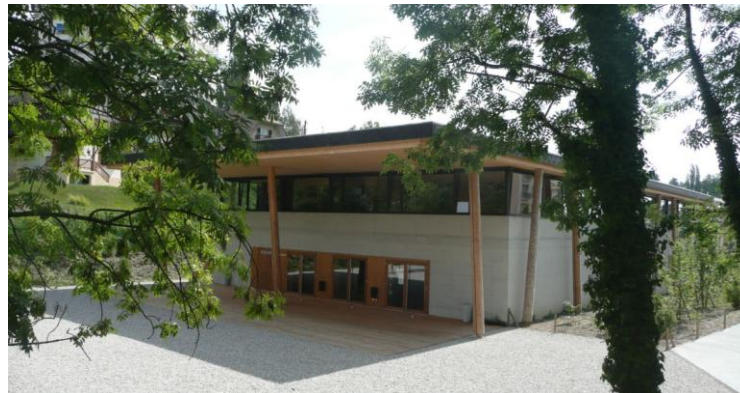
La maison de quartier de Chailly